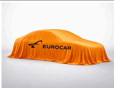
Foto in arrivo